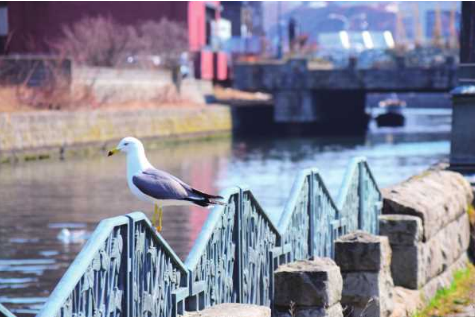
小樽運河とカモメ