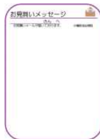
※お見舞いメールフォーマット例